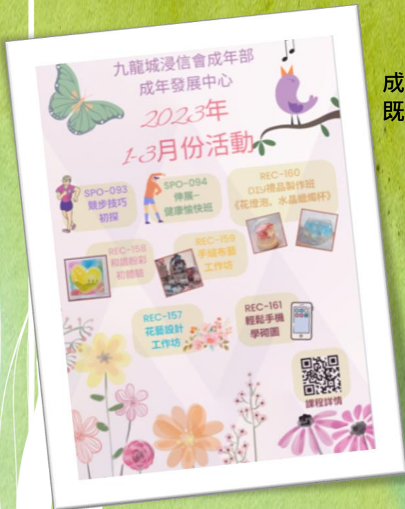
成展課程重新開展，請踴躍帶領未信親友報名，既可消閑，亦可作福音平台