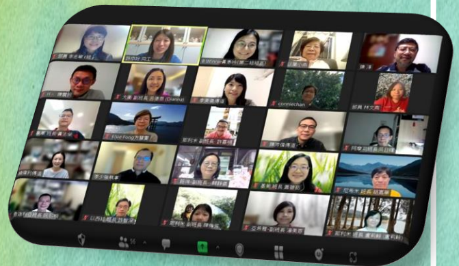
線上班長交流會，大家有美好的分享