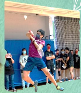
主的恩典加上眾人群策群力，成功舉辦精彩的羽毛球比賽