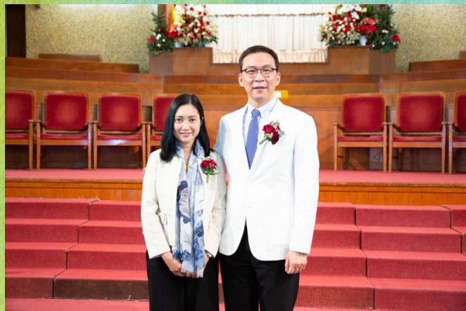
陳牧師與師母 攝於按立禮

信望愛，是我們前行的方向和動力。在2022年12月26日本人被按立為牧師之後，也常提醒自己，侍奉人生必須常被信望愛所充滿和引導，方能承擔更重的職事。盼望在新一年中，我們也以此互相勉勵，成為更有感染力的群體，繼續努力把福音傳開！