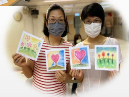
和諧粉彩班，作品十分精美