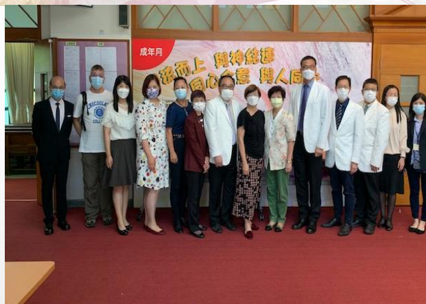
同工部員在展板前留影