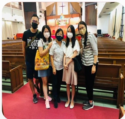
花藝班的學員在佈道會中決志，十分鼓舞