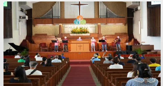
7月10日順利舉行 成年部家庭佈道會